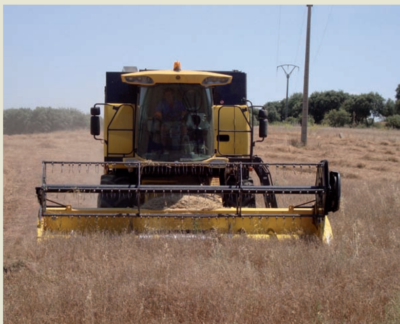
En los últimos meses el precio de los cereales ha alcanzado niveles desorbitados.